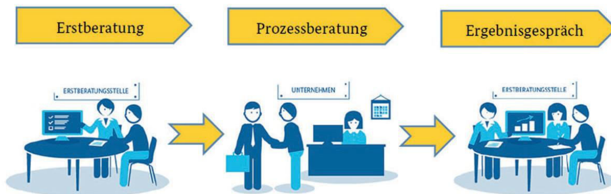
Abb. 2: Beratungsschritte innerhalb des Förderprojekts.

1. Quartal 2017 entscheiden, ob das Programm auch für die nächsten Jahre aufgelegt wird! Solange gilt: Anträge müssen bis spätestens Oktober 2017 gestellt werden und bis Mitte 2018 bearbeitet sein.