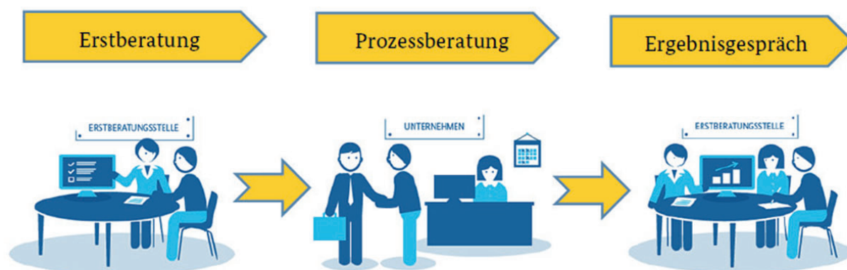
Abb. 2: Beratungsschritte innerhalb des Förderprojekts.

1. Quartal 2017 entscheiden, ob das Programm auch für die nächsten Jahre aufgelegt wird! Solange gilt: Anträge müssen bis spätestens Oktober 2017 gestellt werden und bis Mitte 2018 bearbeitet sein.